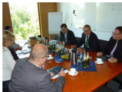
Illustre Runde bei Progeo

Wichtige Termine: 05.12.2013 um 19:00 Uhr im „Schluchtenjodler“ Öffentliche Fraktionssitzung 17.12.2013 um 20:00 Uhr in der „Alte Molkerei“