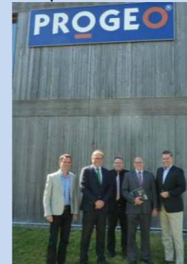
Geschäftsleitung Progeo mit Politik