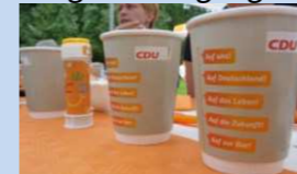
Verschiedene Beteiligungsformen - Machen Sie mit