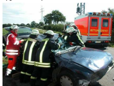
Bild: Damit die Rettung aus einem Fahrzeug schnell und sicher geht.

Wo soll die Rettungskarte aufbewahrt werden?